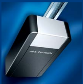
tousek Garagentorantriebe sparsam und schnell