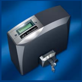
tousek Schiebetorantriebe kompakt und sicher

Ausführung, Zusammenstellung, technische Veränderungen sowie Satz- und Druckfehler vorbehalten. Alle Inhalte sind Urheberrechtlich geschützt. Nachdruck, digitale Vervielfältigung, auch auszugsweise, nur mit unserer schriftlichen Genehmigung.