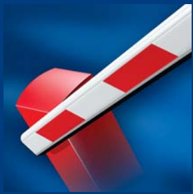
tousek Schrankensysteme formschön und robust