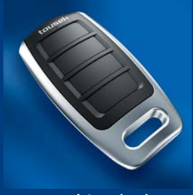
tousek Impulsgeberprogramm kompatibel und sicher